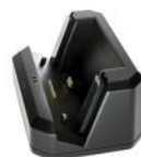
Docking Station (1x M10Q + 1x Bateria) 3x USB + RJ45